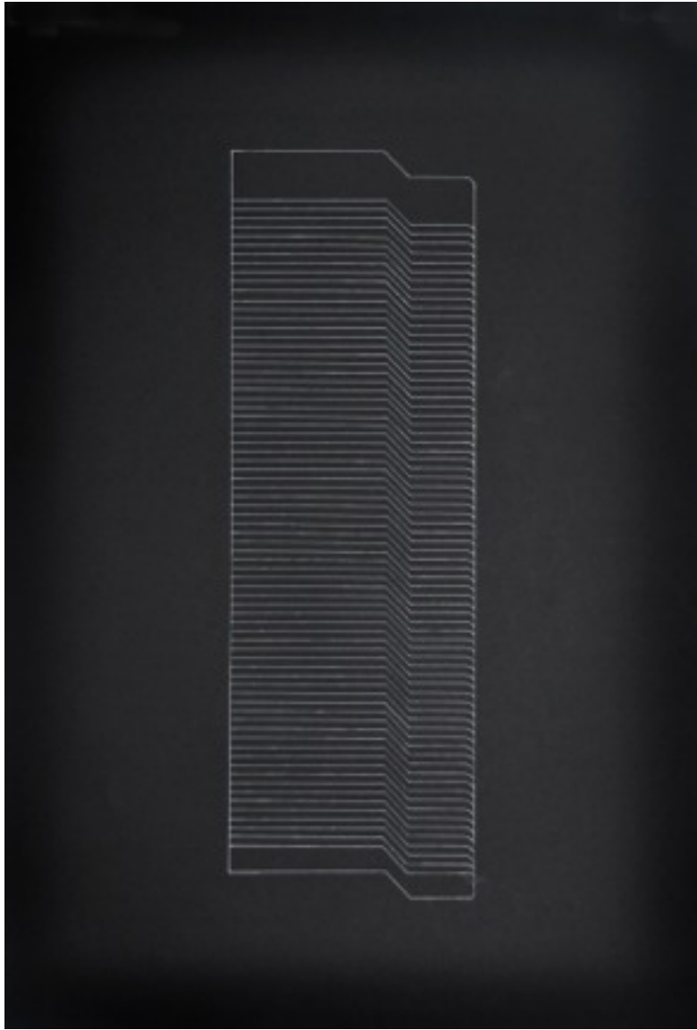
Dessin, encre blanche sur carton noir 300 g 70 x 100 2014 eliane gervasoni