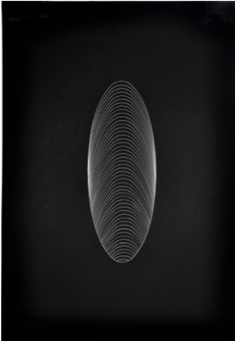
Toujours Dessin, encre blanche sur carton noir 300 g 70 x 100 2014 eliane gervasoni